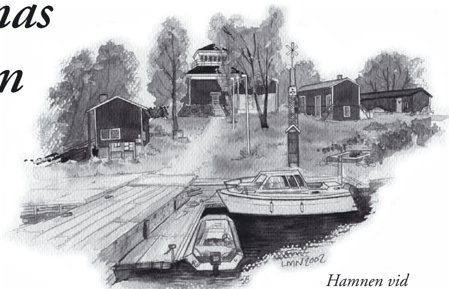
Hamnen vid naturstationen.

I Maxmo kommuns yttre skärgård 20 km norrut från Köklot fiskehamn.